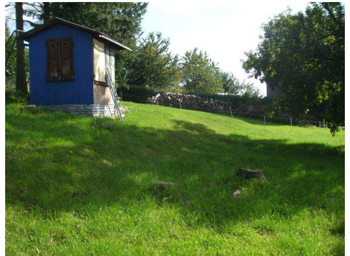
Terrassenförmig angelegter Garten und die Terrasse (leider durch unsere Abwesenheit etwas verwildert)