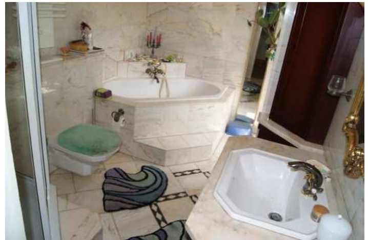
Bad Haupthaus oben