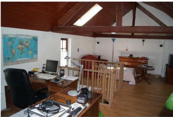
Büro Anbau 1. Stock