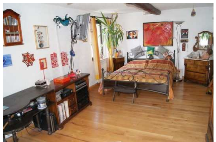
Haupthaus Schlafzimmer 1. Etage