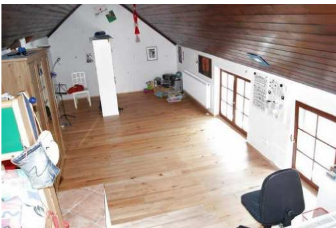
Kinderzimmer Haupthaus 1. Etage