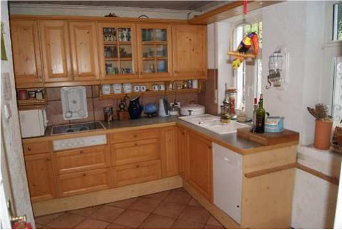
Küche (in Renovierung)