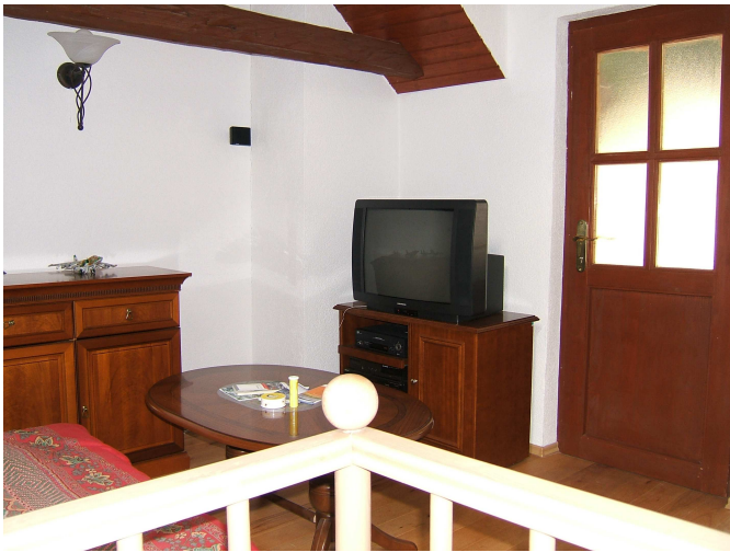
Gartenzugang vom Büro