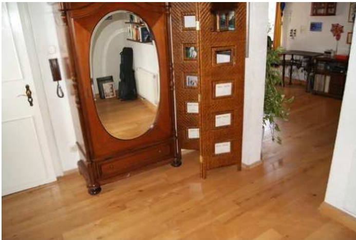
Ankleidezimmer / Bibliothek

Wir haben uns aus beruflichen Gründen entschließen müssen, dieses Haus und den Ort zu verlassen und sind immer noch ein wenig traurig darüber. Für eine Familie mit Platzbedarf für Kinder, Haustiere, Hobbygärtner, Motorradfahrer, Homeoffice und Spaß an freier Entfaltung und schöner Natur ist dieses Haus ein ideales Zuhause.